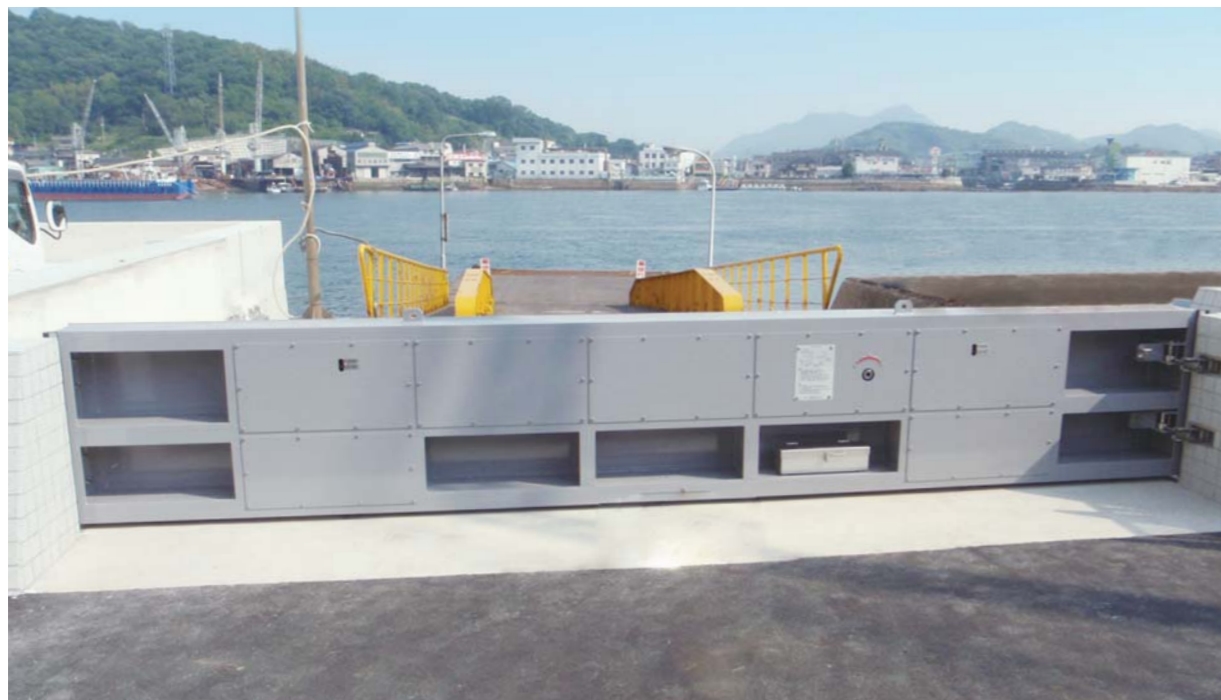
広島県東部建設事務所三原支所(スイングゲート6.00m×0.97m)