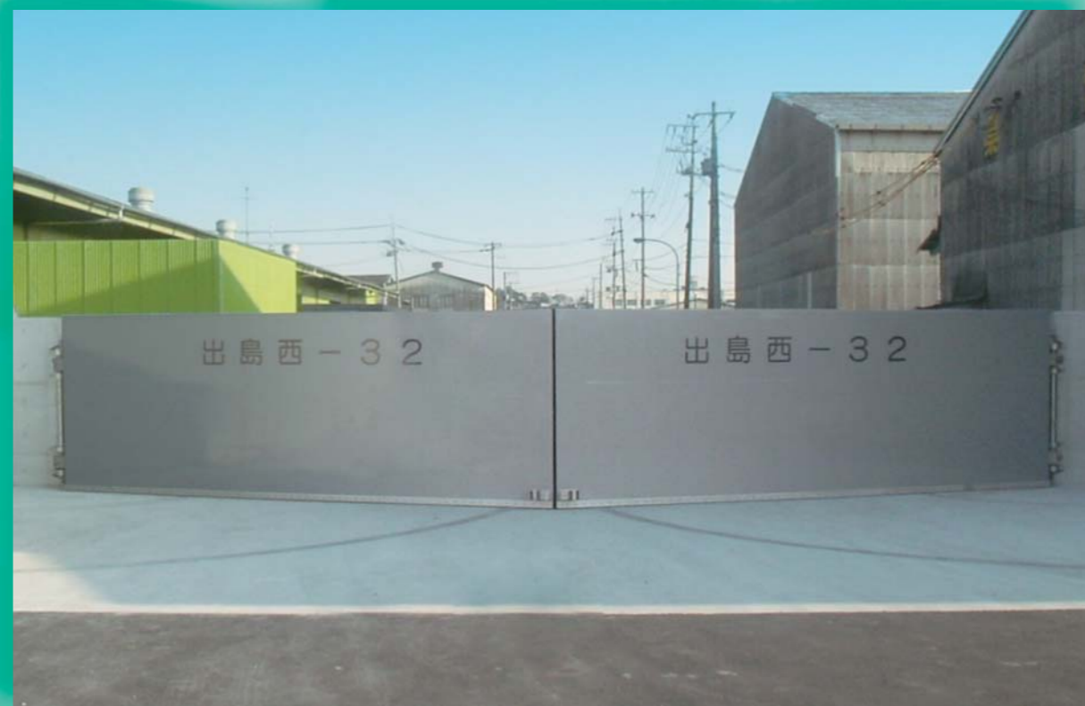
広島県広島港湾振興局(マイターゲート11.50m×2.15m)