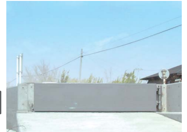
国土交通省岡山河川事務所(スイングゲート)