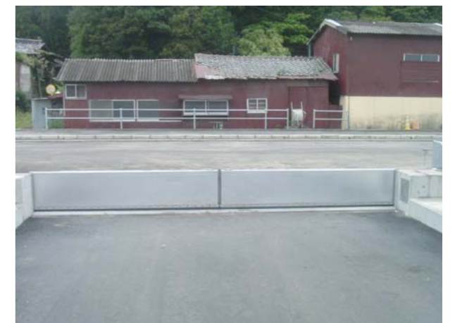
愛媛県上島町(マイターゲート)