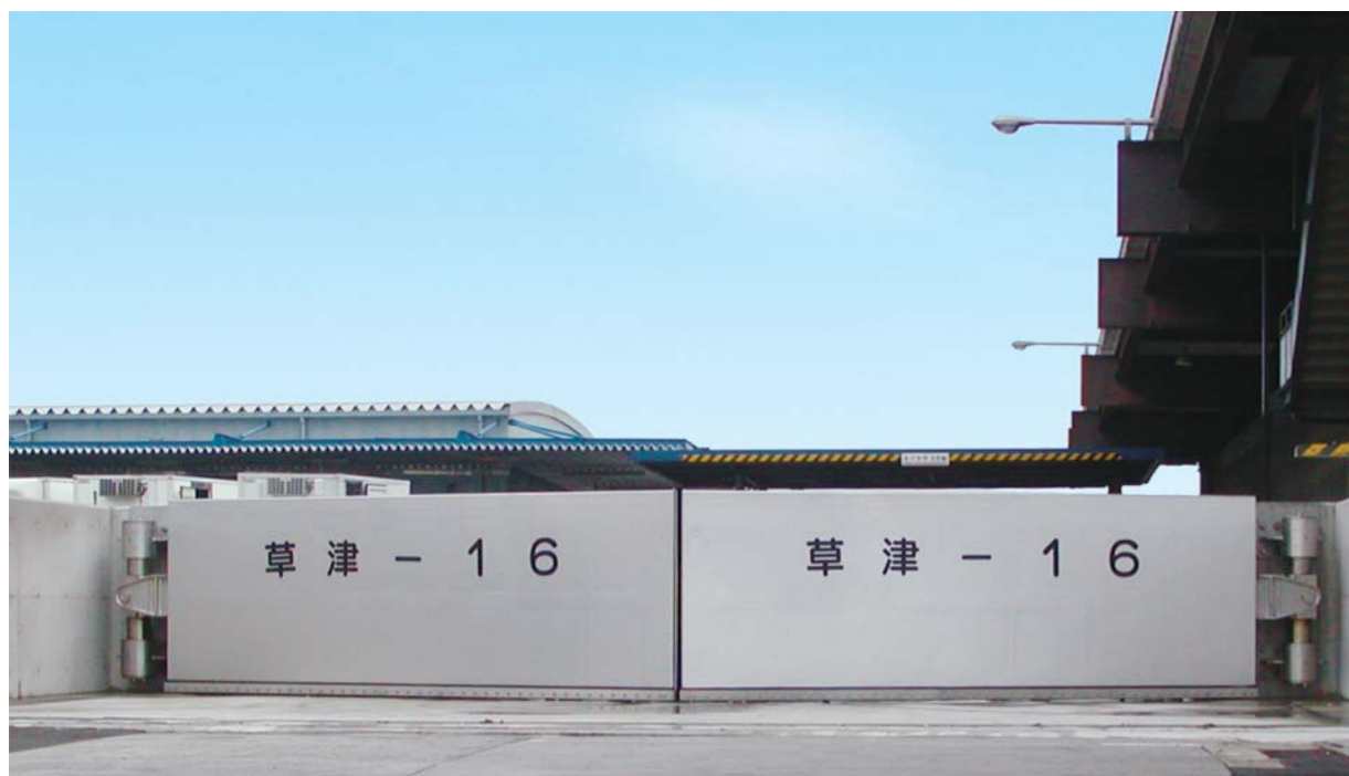
広島県広島港湾振興局(マイターゲート8.00m×1.60m)