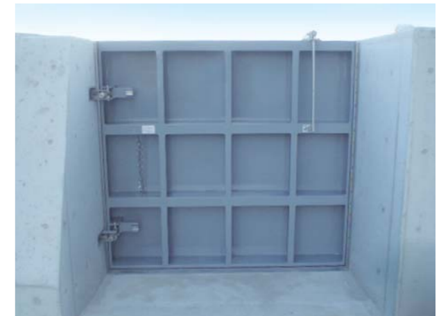
広島県西部建設事務所(スイングゲート)